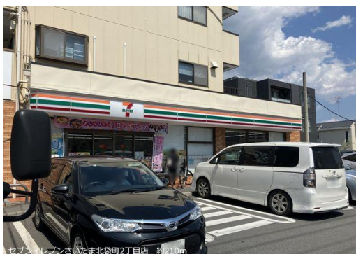
セブンイレブンさいたま北袋町2丁目店 約210m